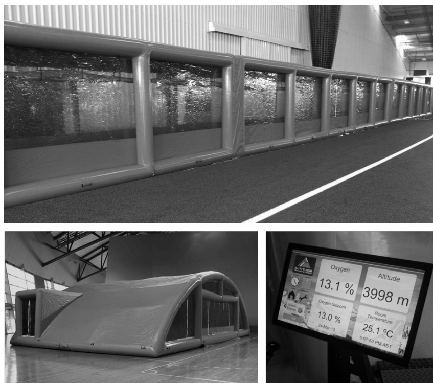
Figura 1. Presentación del sistema de hipoxia simulada inflable móvil. Túnel externo (panel superior), diseño rectangular (panel inferior izquierdo) y controlador de pantalla táctil (panel inferior derecho).