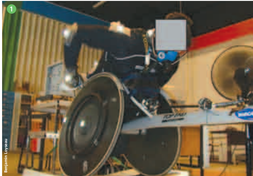
Figure 1 - Représentation de l'athlète sur l'ergomètre.