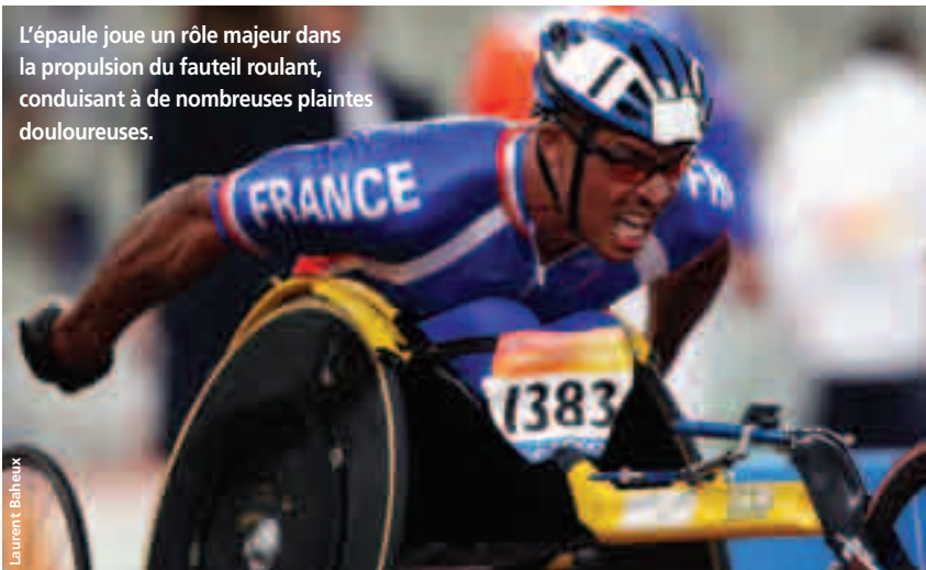
L'épaule joue un rôle majeur dans la propulsion du fauteuil roulant, conduisant à de nombreuses plaintes douloureuses.

Les athlètes devaient produire le maximum de vitesse pendant une période de 1 minute 30 secondes. La consigne était d'atteindre leur vitesse maximale le plus vite possible.