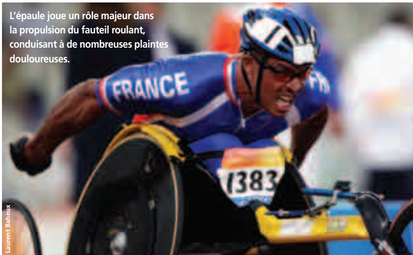
L'épaule joue un rôle majeur dans la propulsion du fauteuil roulant, conduisant à de nombreuses plaintes douloureuses.

Les athlètes devaient produire le maximum de vitesse pendant une période de 1 minute 30 secondes. La consigne était d'atteindre leur vitesse maximale le plus vite possible.