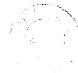
Tableau 9 : comment avez-vous connu la BF ? (réponses à la question 4)