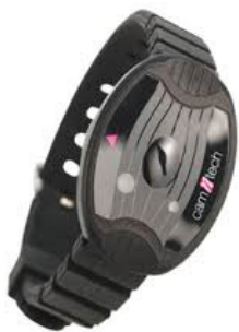
Figure 1 - Exemple de nouvelle génération d'actigraphe. Le modèle MotionWatch (© CamNtech, Cambridge, UK) intègre un accéléromètre tri-axial permettant de quantifier les mouvements.

taille de l'effet : 3,2 et 2,8, respectivement). Dans cette étude de cas, la durée nécessaire pour s'endormir et l'efficacité de sommeil étaient altérées à la fois au cours de la nuit et de la semaine précédant la survenue d'une blessure. Un suivi individualisé du sommeil, en particulier dans les contextes de charge d'entraînement importante et de compétitions, pourrait être utile à la prévention de la blessure.