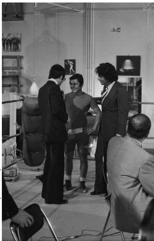
Yves Mourousi s'entretient avec le boxeur Aldo Cosentino aux côtés d'Enrico Macias lors du tournage de l'émission Feux croisés (septembre 1973).