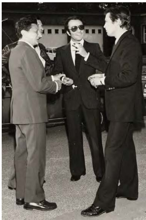
L'écrivain Léo Malet converse avec Yves Mourousi et le comédien Alain Delon (septembre 1973).