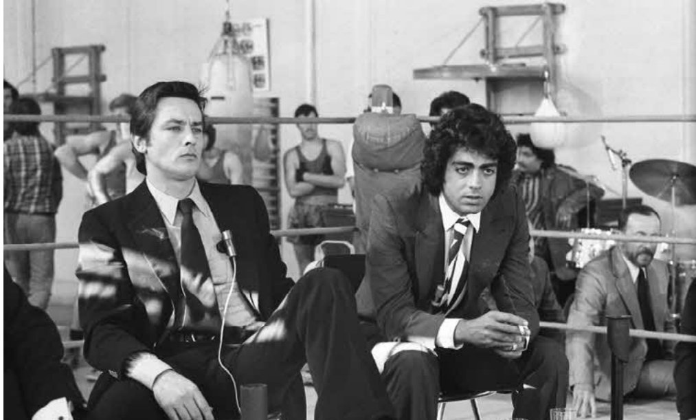
Le comédien Alain Delon et l'artiste Enrico Macias lors du tournage de l'émission Feux croisés (septembre 1973) à l'Institut national du sport (INS), ancêtre de l'Insep actuel.